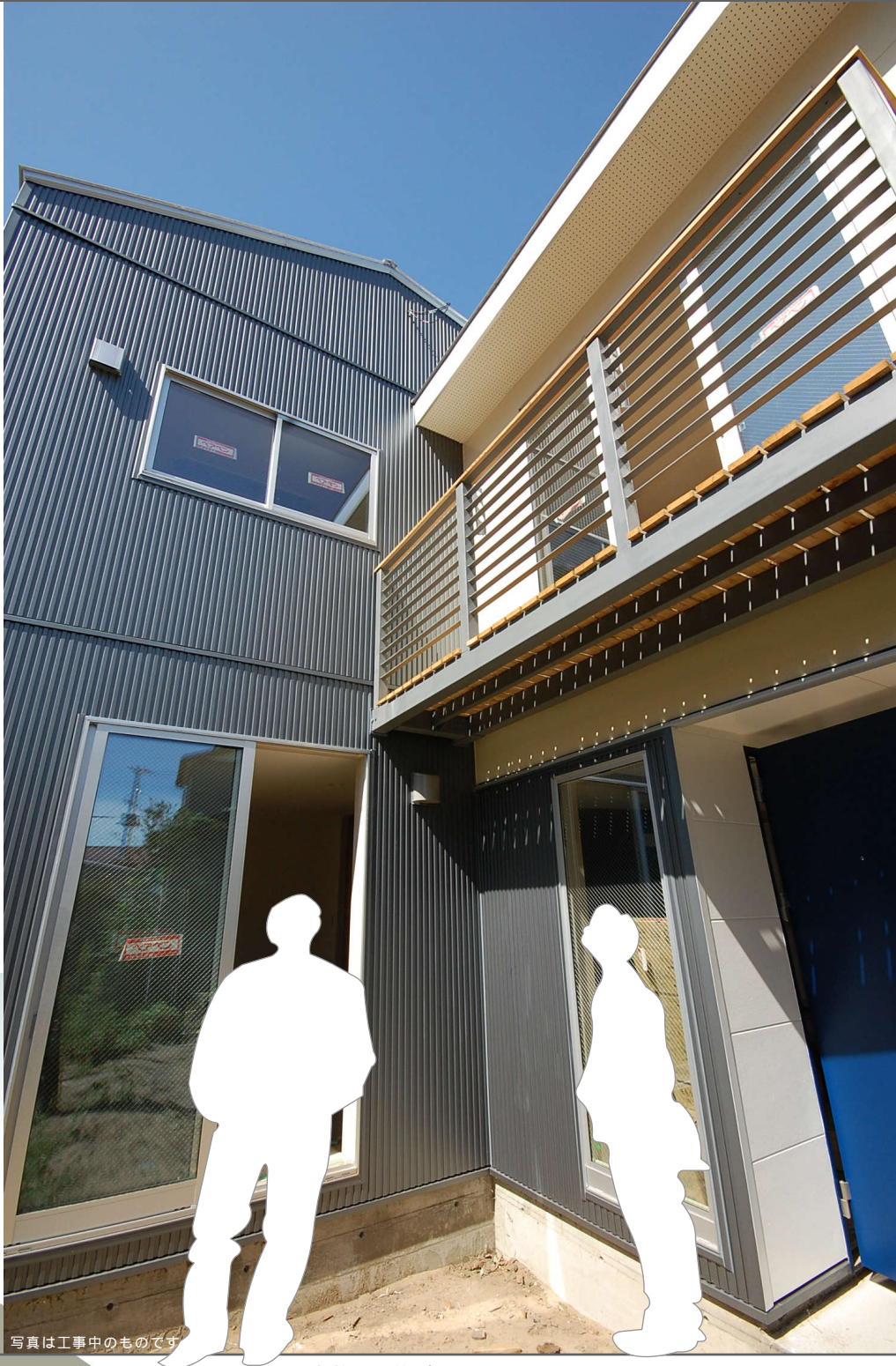
写真は工事中のものです

事前に予約が必要です フリーダイヤル 0120-77-8164 (ASJ 秋田スタジオ)